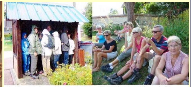
Sorties pédestres - G2 - Les Authieux Ratiéville G1 - St Pierre du Vauvray