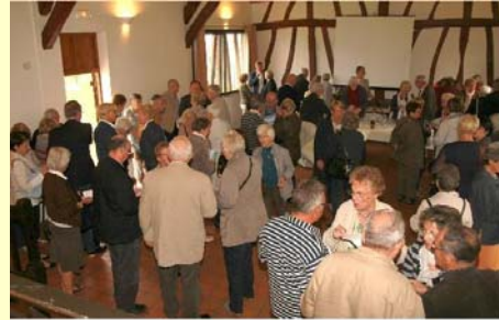
Aperitif de Rentrée - 21 sept 2012