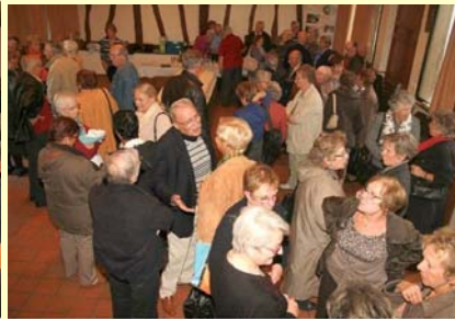
Assemblée Générale - 12 oct 2012